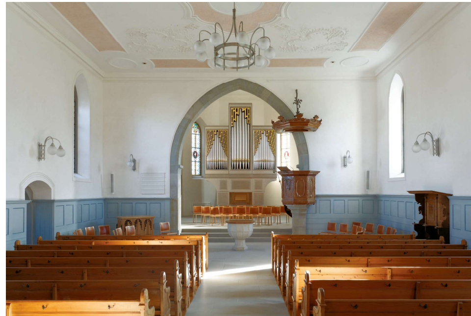
Reformierte Kirche Kilchberg

«Gemeinschaft» ist ein Wort, das in der Kirche schnell vertraut klingt. Wir gebrauchen es oft: im Gottesdienst, in Sitzungen, auf Flyern und Leitbildern. Doch was meinen wir eigentlich, wenn wir von Gemeinschaft sprechen? Und warum ist sie für den christlichen Glauben grundlegend?