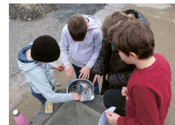
Beim Unservater und «verbrennen Schuld»