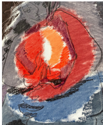
«Ohne Titel», Erika Streit (1969), www.erika-streit.ch

Das Programm in der Kirche auf dem Berg umfasst Werke aus der Matthäuspassion von J. S. Bach, das «Pie Jesu» aus dem Requiem von Maurice Durufle, bis hin zur herrlich einfachen «Summa für