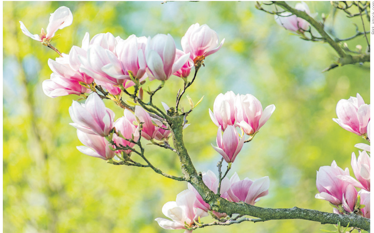
Mit dem beginnenden Frühling werden Lockerungen der einschneidenden Massnahmen in Aussicht gestellt.