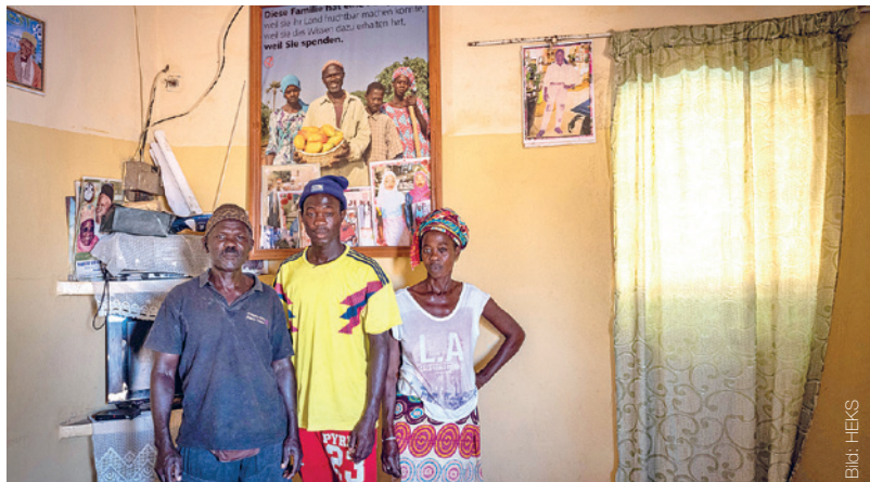
Spendentätigkeit des HEKS in Entwicklungsländern