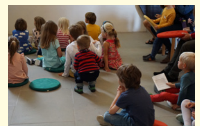
Andächtiges Zuhören, Singen und Spielen in der Chinder Chile.

4. September, 10.00 Uhr, reformierte Kirche