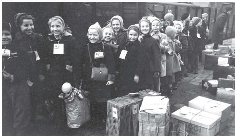
Flüchtlingskinder in der Schweiz

Vom 1. bis 20. September zeigt die Reformierte Kirche Kilchberg die Fotoausstellung «75 Jahre HEKS» (Hilfswerk der Evangelischen Kirchen Schweiz). 24 eindrückliche Bilder zeigen wichtige Stationen auf der Reise des Hilfswerkes durch ein Dreivierteljahrhundert.