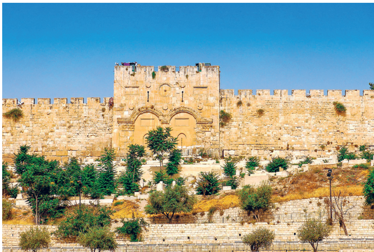
Wiederaufbau der Stadtmauern von Jerusalem ab ca. 520 v. Chr.